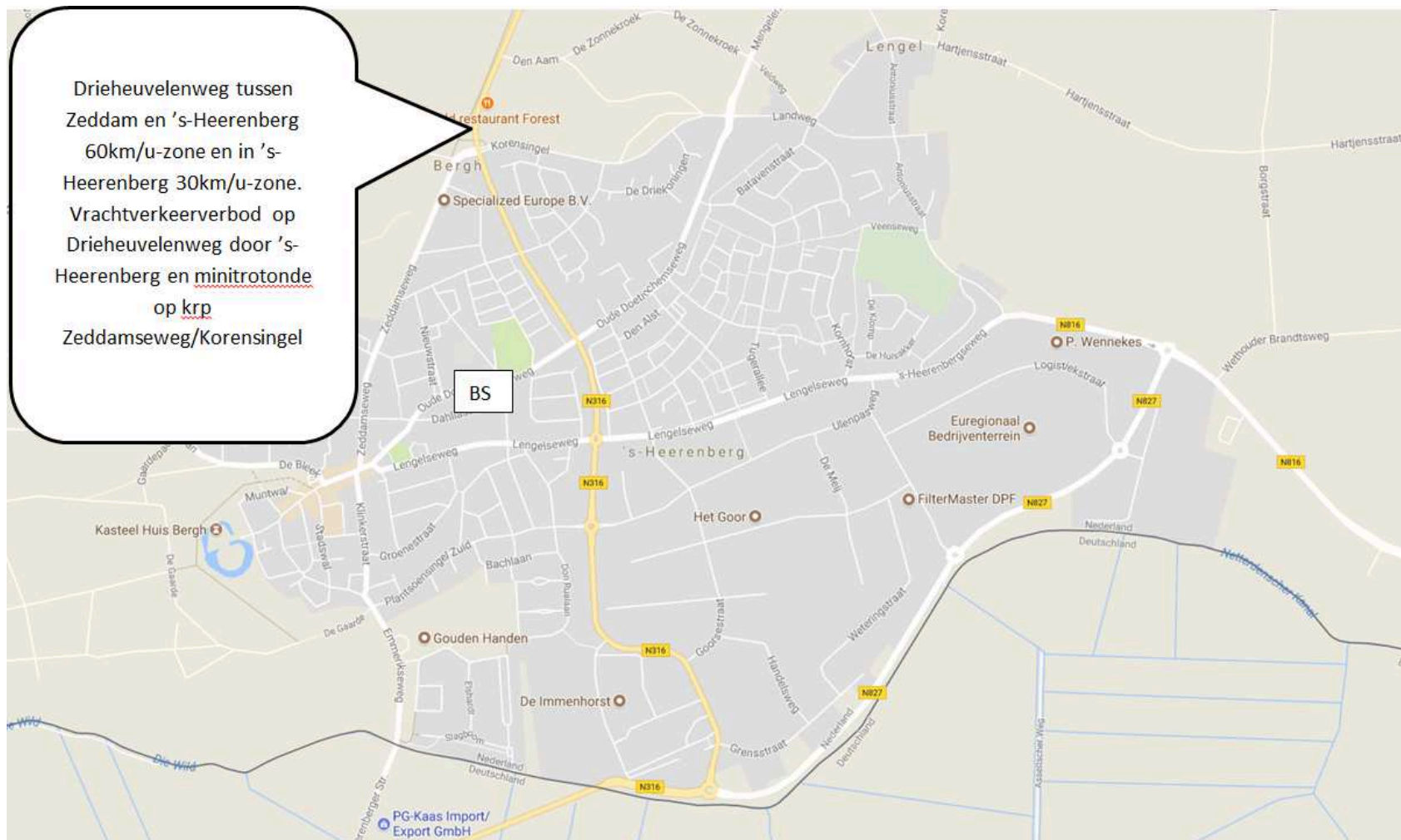
Bijlage 2 brede school op 'Katjaterrein'. Drieheuvelenweg afgewaardeerd conform afspraak provincie Gelderland