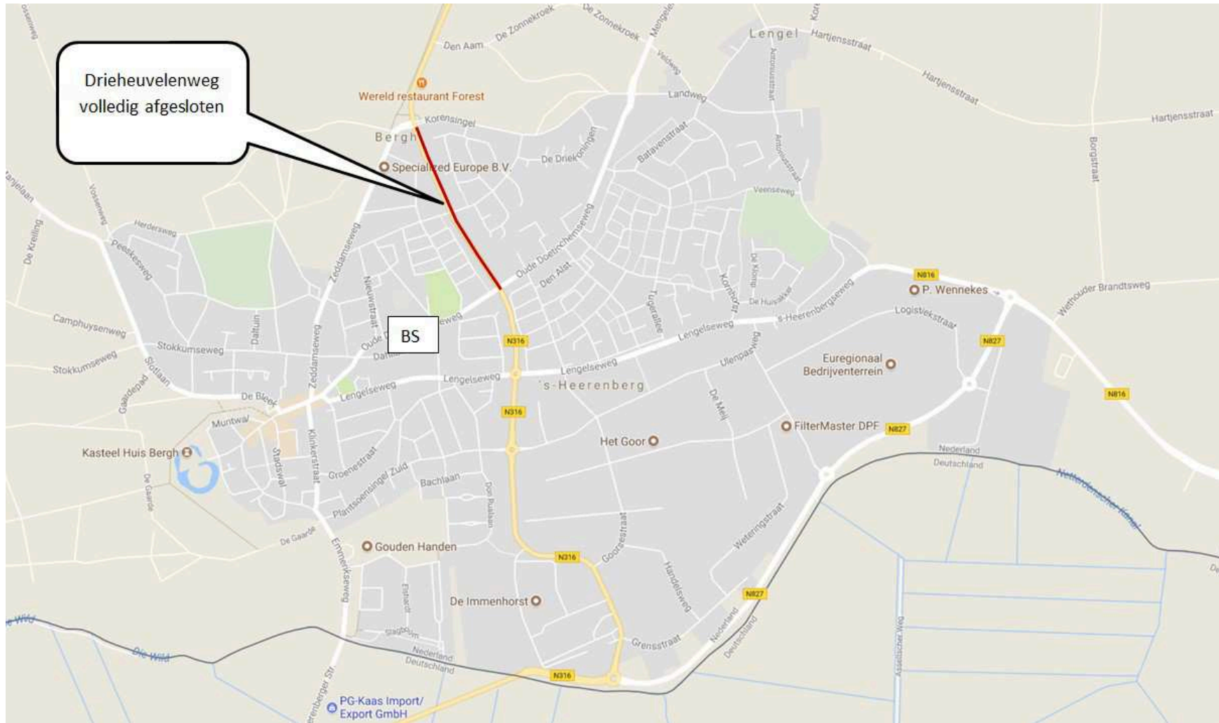
Bijlage 3 brede school op 'Katjeterrein'. Drieheuvelenweg afgesloten