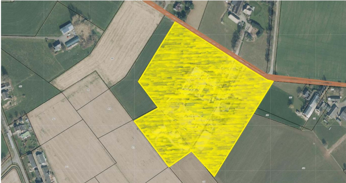
Figuur 2 Perceel aan de Groot Lobberikweg (geel) en de Groot Lobberikweg (bruin)

Op [REDACTED] te Loerbeek ligt gedeeltelijk een bedrijfsbestemming. De huidige feitelijke bedrijfswerkzaamheden overschrijden het bestemmingsvlak. Indien er verzoekt dit bestemmingsvlak te vergroten, passend bij de huidige werkzaamheden.