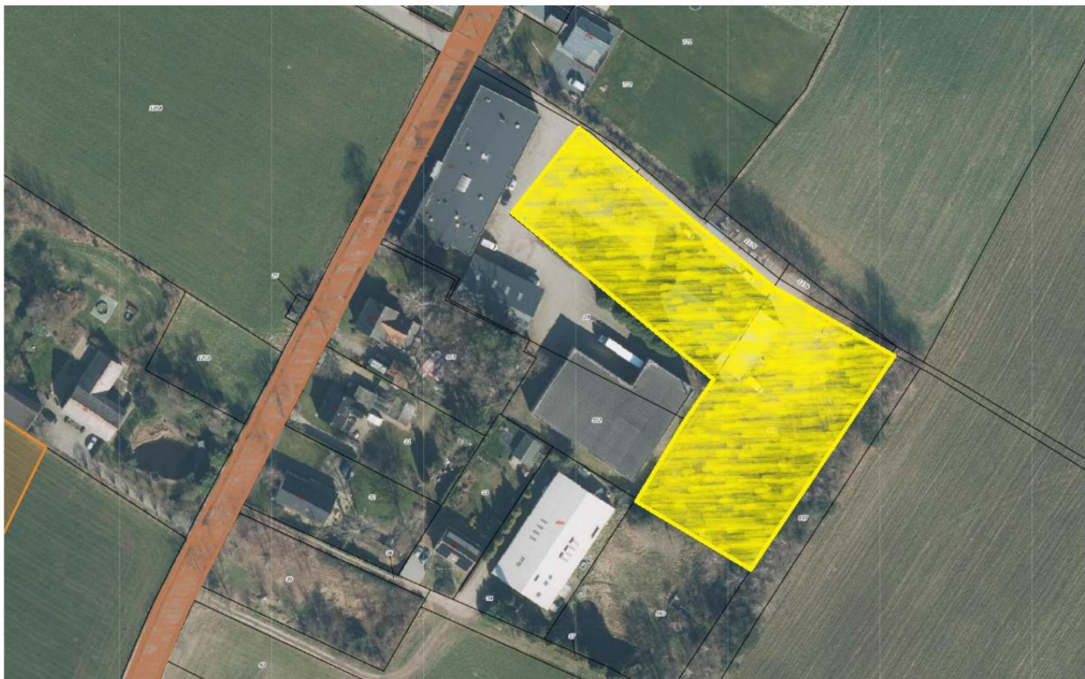
Figuur 1: perceel aan de Sint Jansgildestraat (geel) en de Sint Jansgildestraat (bruin)

Op de Sint Jansgildestraat [redacted] J te Beek ligt op dit moment een bedrijfsbestemming (zonder bedrijfswoning), een archeologische verwachting, en gebiedsaanduidingen betreffende het conserverende dek en waardevol landschap. Indiener verzoekt of positief wordt gekeken naar een