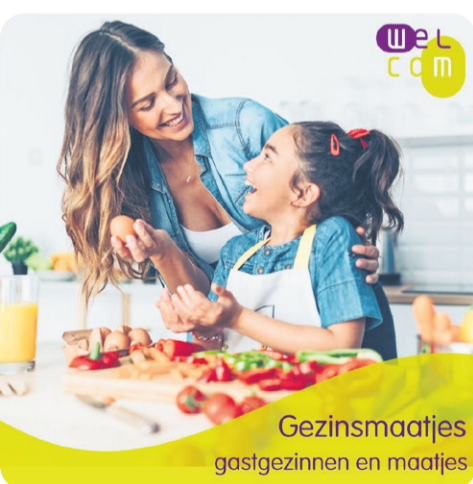
Gezinsmaatjes gastgezinnen en maatjes

Wilt u komen? Stuur dan een mail naar Clemenda Som: c.som@montferland.info .